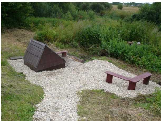
Родник после благоустройства готов к приему посетителей!