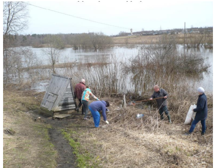
Уборка территории членами ТОС «Борок»