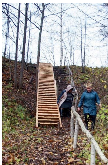
Спуск к роднику