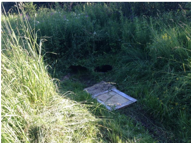
До начала работ по благоустройству родник выглядел так...