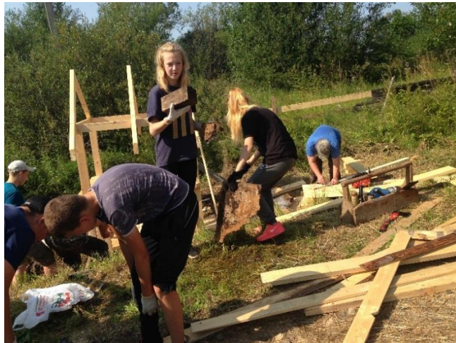
Все работы выполнялись членами школьного лесничества «Зеленый бор» совместно с шефами ОГКУ «Межевское лесничество», местными предпринимателями.