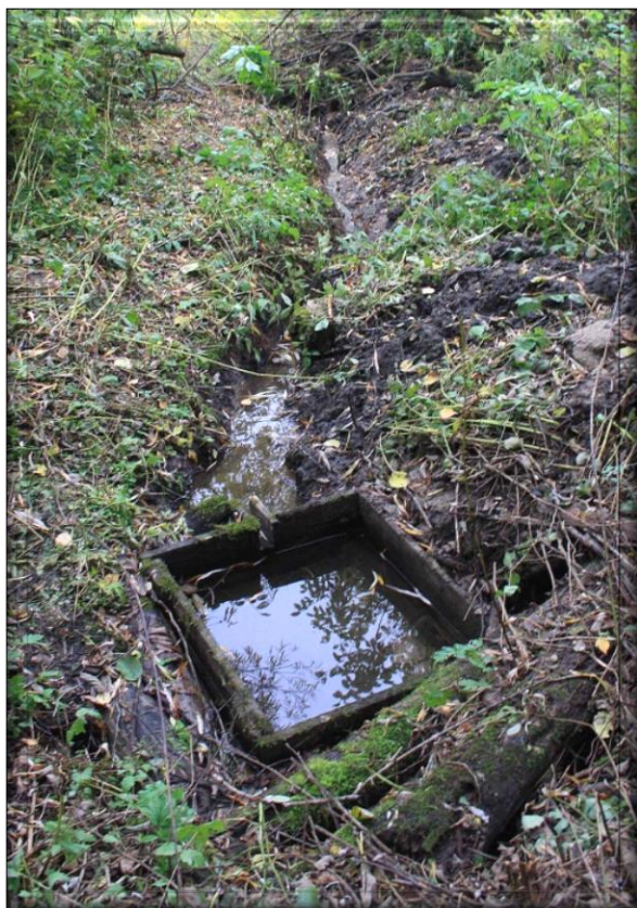
Родник до благоустройства