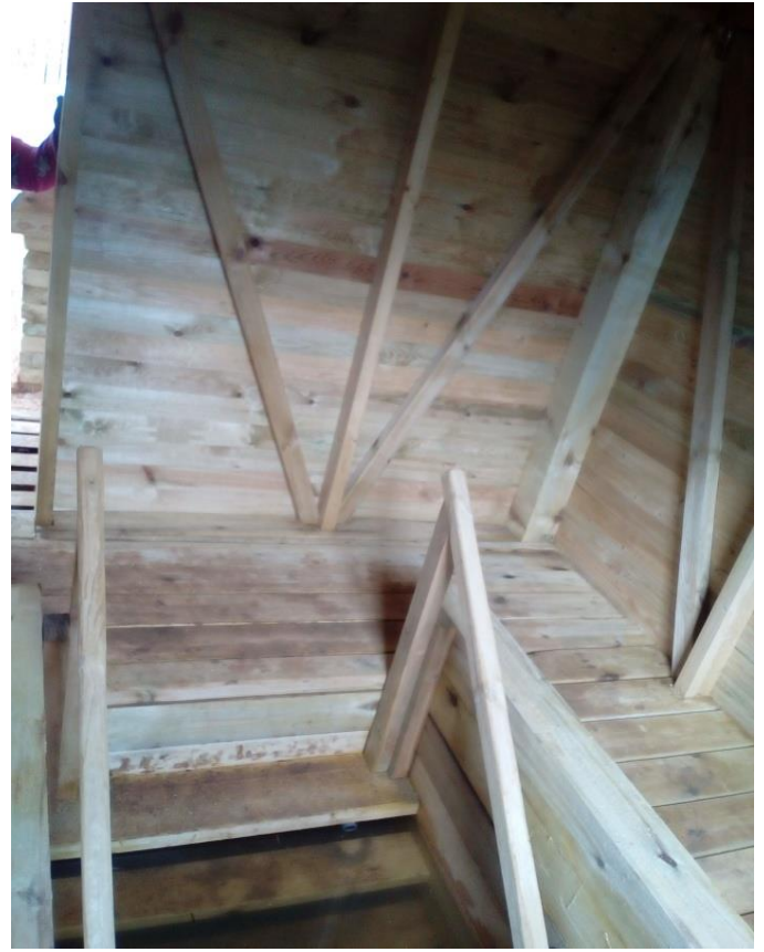
Благоустроенный родник и купальня