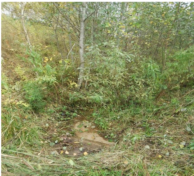
Так выглядел родник до благоустройства